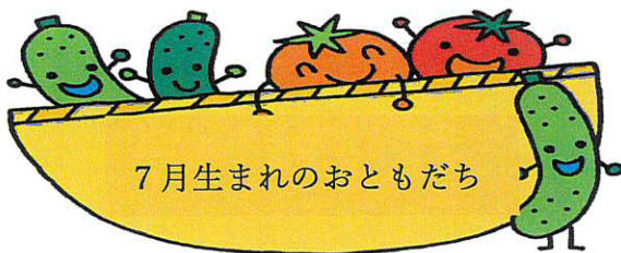
7月生まれのおともだち